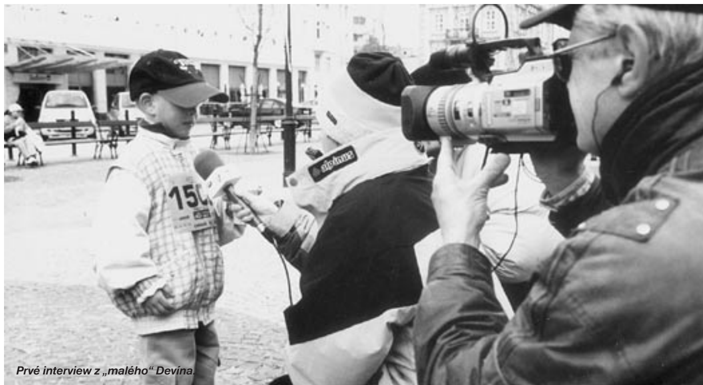
Prvé interview z „malého“ Devína.