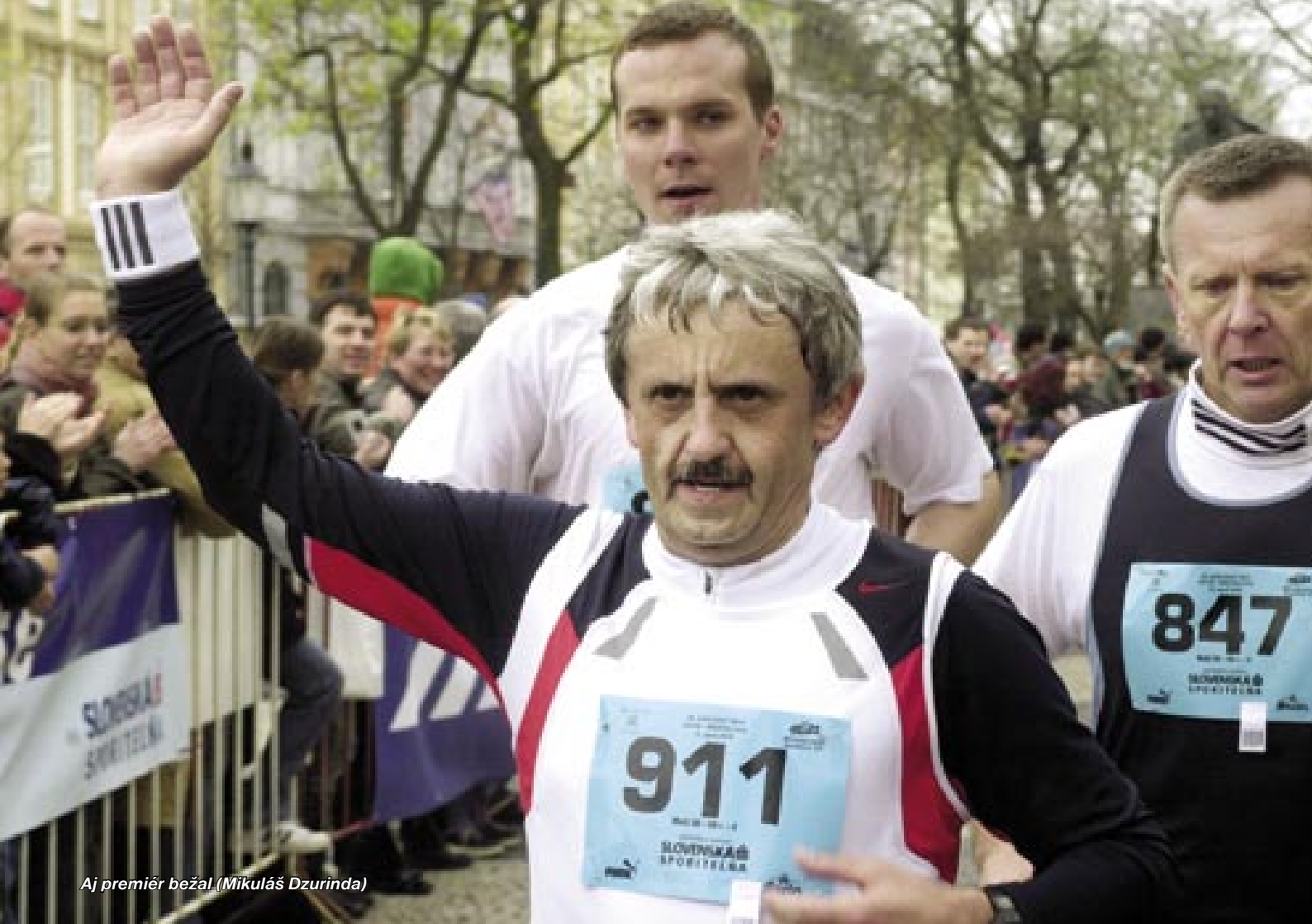
Aj premiér bežal (Mikuláš Dzurinda)