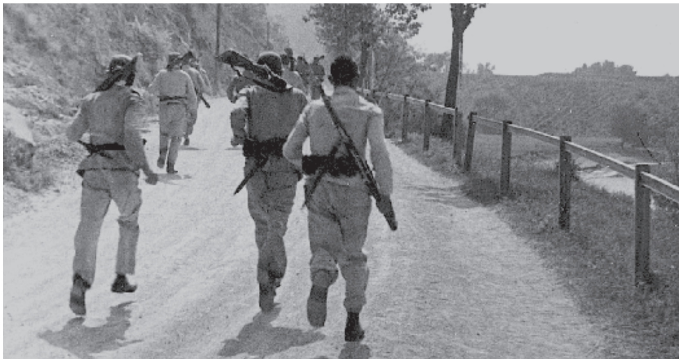
Rok 1934: Vojaci aj s poľnou.