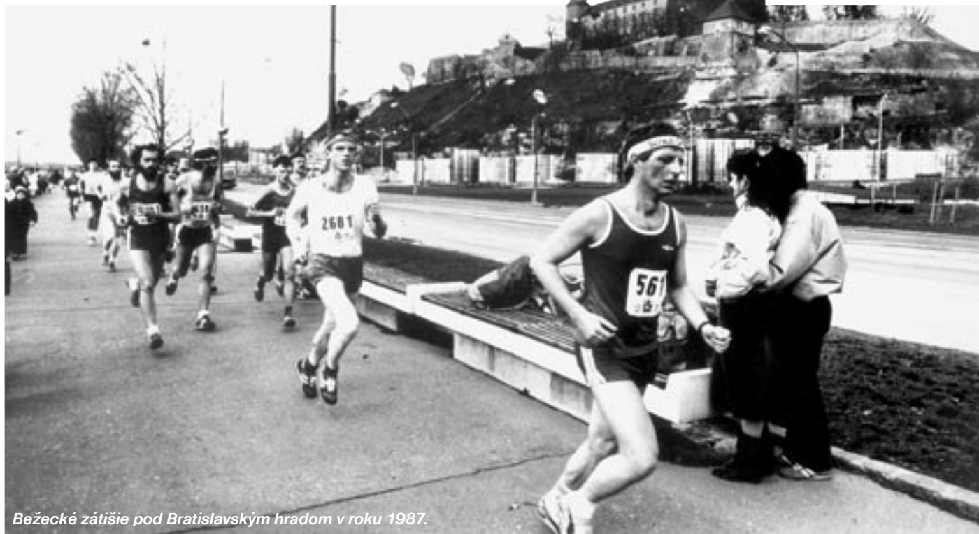
Bežecké zátišie pod Bratislavským hradom v roku 1987.